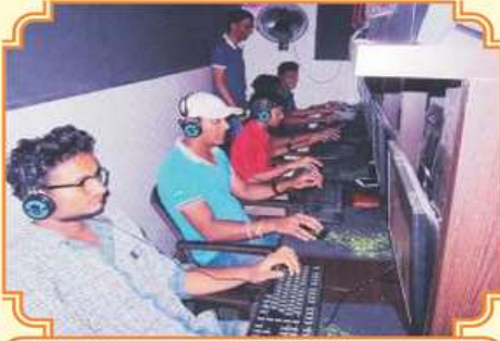
કાઉન્ટર સ્ટ્રાઇક સ્પર્ધા

૨૬-૨૭ નવેમ્બર ૨૦૧૬ કાઉન્ટર સ્ટ્રાઇક સ્પર્ધા અને ક્રિકેટ ટૂર્નામેન્ટની ઝલકો