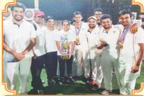
ક્રિકેટ સ્પર્ધાના રનર અપ અનંતછાયા ચંગસ્ટર્સ ટીમ