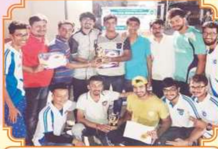
વોલીબોલ સ્પર્ધાની વિજેતા ટીમ