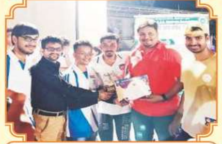
વોલીબોલ સ્પર્ધાના રનર અપ