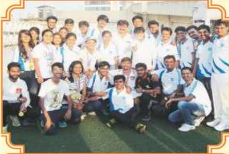
વિદ્યાર્થીસંઘના કાર્યકર્તા સાથે મહાનુભાવો