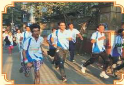
મેરેથોન રેસ માં દોડતા સ્પર્ધકો