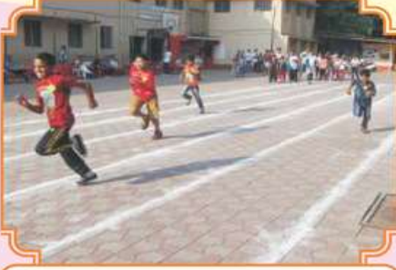
૧૦૦ મીટર રનીંગ રેસ સ્પર્ધા