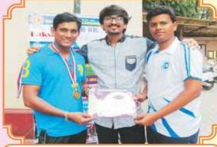
ચેસ સ્પર્ધાના વિજેતા