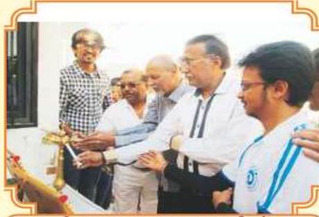
દીપ પ્રાગટ્ય કરતા ઘાતાશ્રીઓ અને મહાનુભાવો