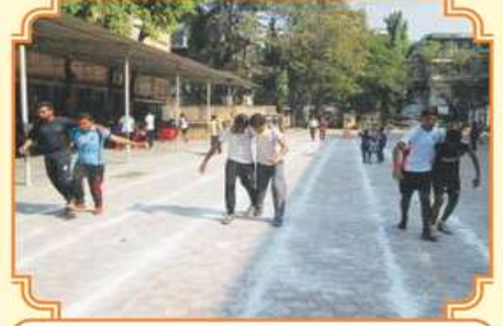
૩ લેગ રેસ સ્પર્ધા