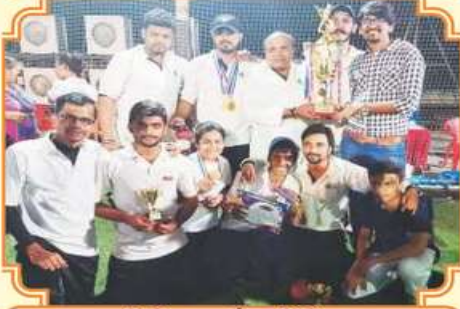
ક્રિકેટ સ્પર્ધાના વિજેતા મુલુન્ડ ચંગસ્ટર્સ ટીમ