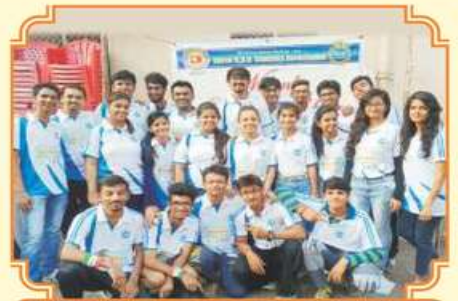
શ્રી વિદ્યાર્થીસંઘની ટીમ