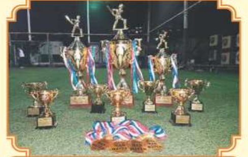
ક્રિકેટ માટેની ટ્રોફી અને મેડલ્સ